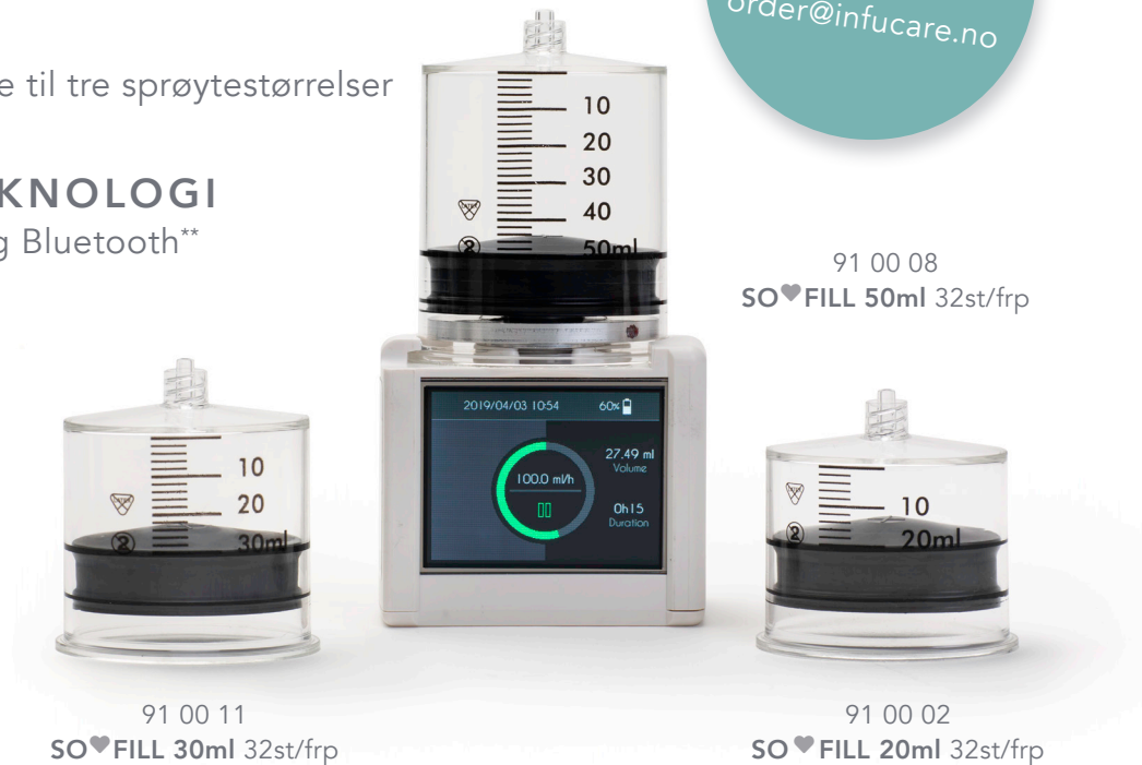
91 00 11 SO♥FILL 30ml 32st/frp