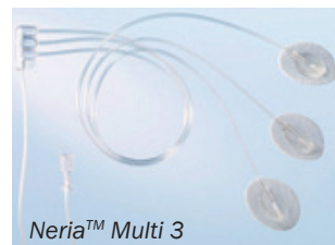
Neria™ Multi 3