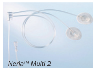
Neria™ Multi 2