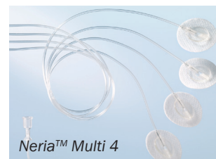
Neria™ Multi 4