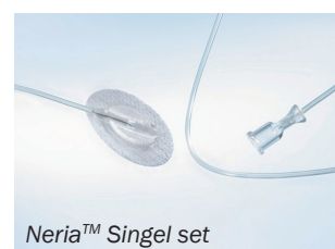
Neria™ Singel set

Önskas VARUPROV? Beställ på info@infucare.se